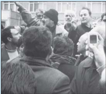
گزارش قلم معلم از گردهمایی